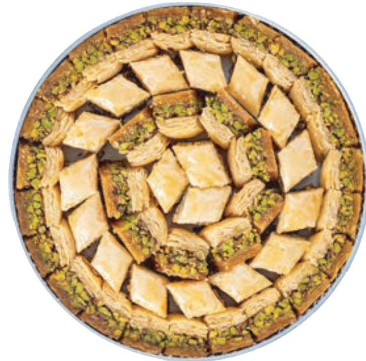
بقلاوة Baklava 700 - 900 - 1300 - 1800g