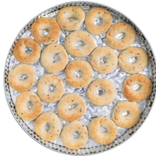
كعك عجوة بزيت الزيتون Dates Ka'ak With Olive Oil