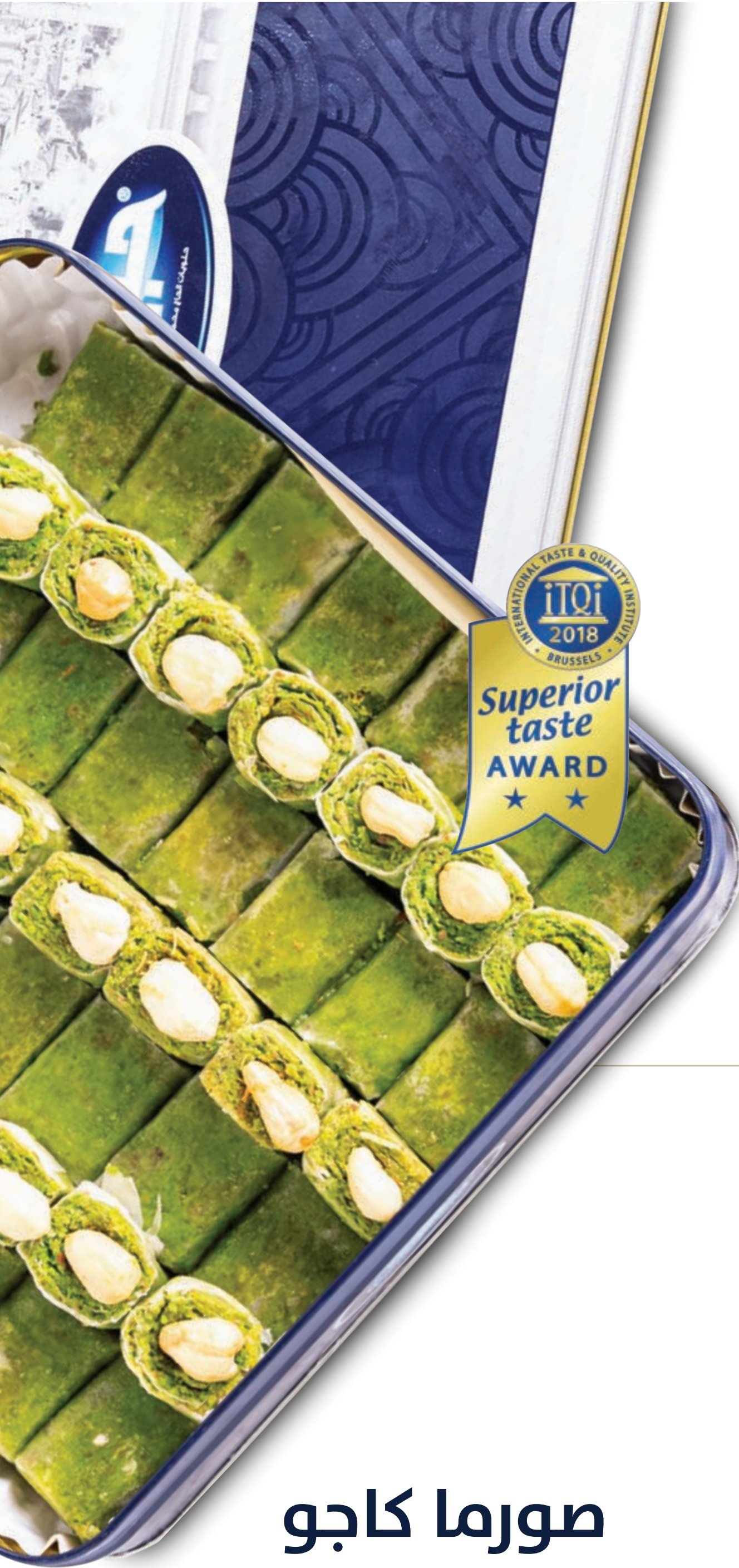
صورما كاجو Cashew Sourma