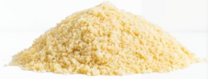
عجينة كنافة ناعمة Fine Kunafa Dough