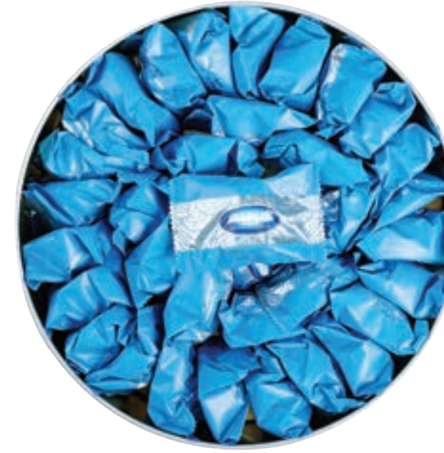
معمول عجوة Dates Ma'amoul