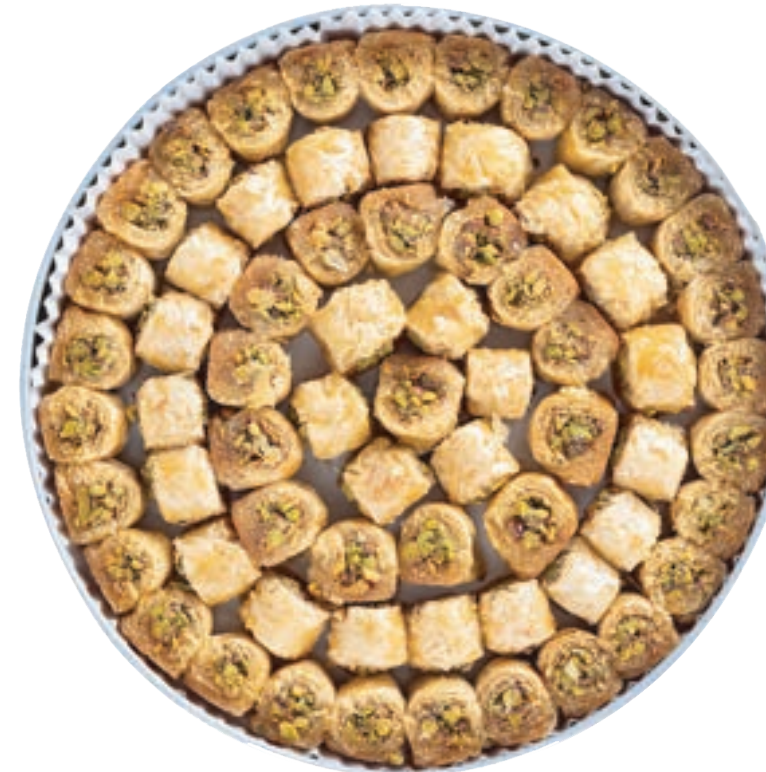
كل و اشكر Kol W Oshkor 700 - 900 - 1300 - 1800g