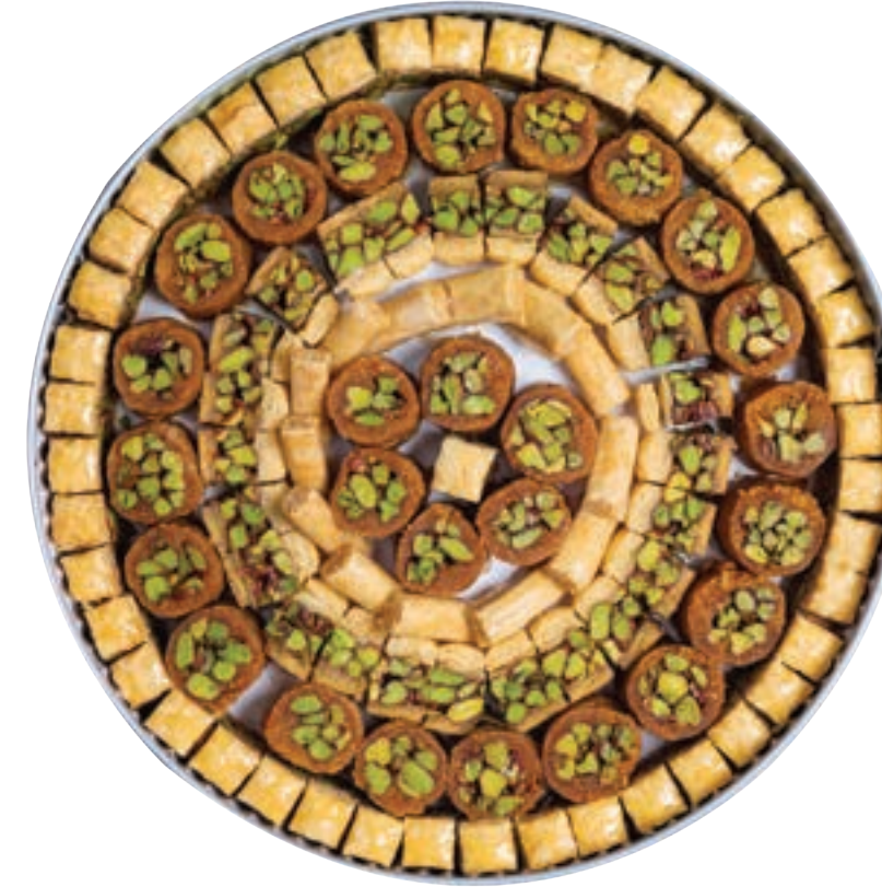
مشكل حبة صغيرة Assorted Mini Arabic Sweets