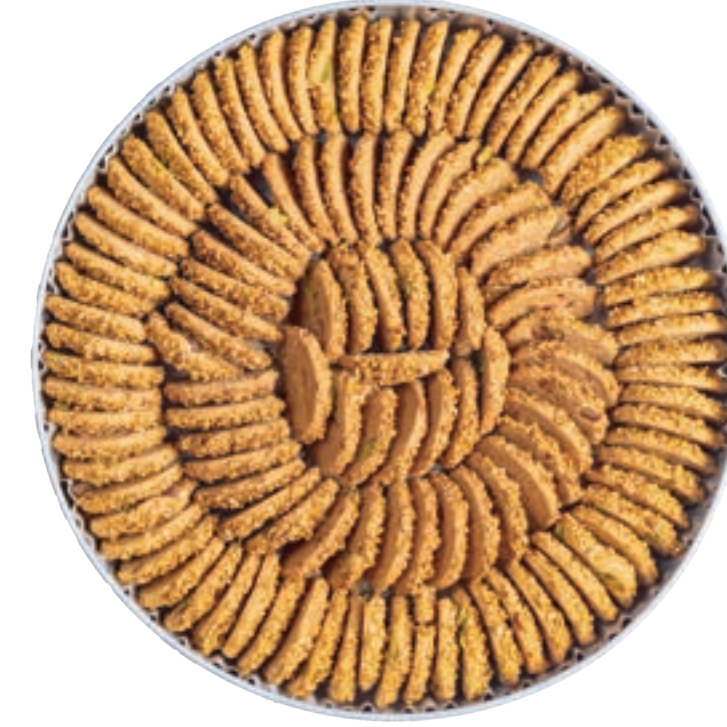
برازق Barazek 900g