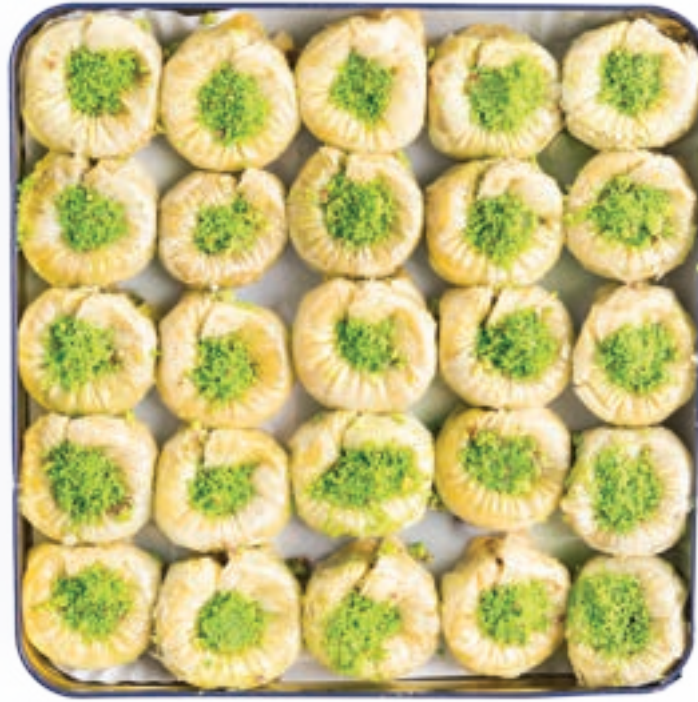
اساور جوز / فستق Walnut / Pistachio Asawir 700 - 900 - 1300g