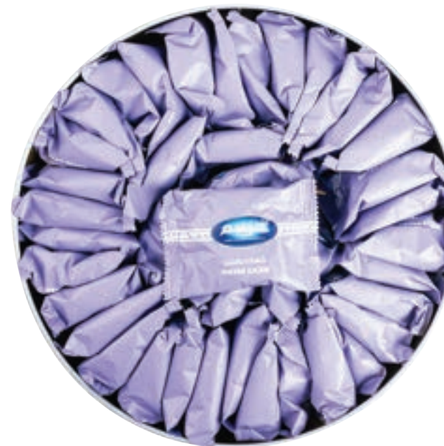
كعك عجوة Dates Ka'ak