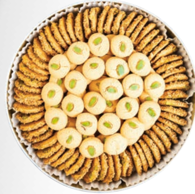
برازق وغريبة محمصة Barazek & Roasted Ghraybeh 900g