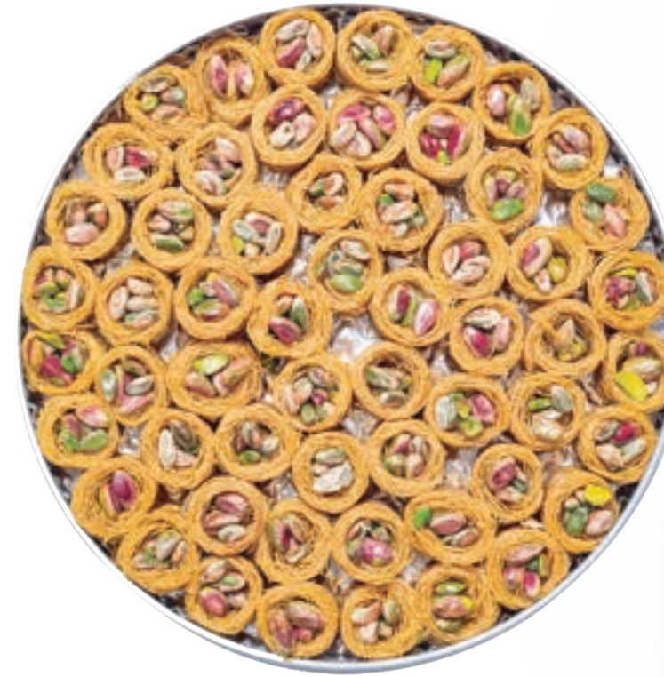
عش البلبل بالفستق الحلبي / كاجو Pistachio / Cashew Ush Al-bulbul 700 - 900 - 1300g