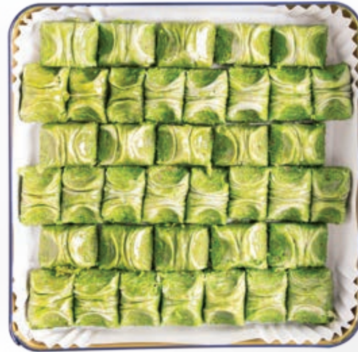
اصابع زم Zam Fingers 700-900g