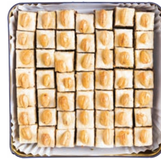
مربعيات كاجو / لوز Cashew / Almond Squares