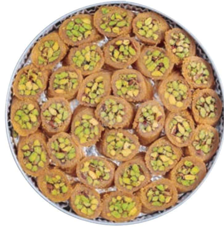
برما بالفستق الحلبي Pistachio Burma 700 - 900 - 1300g