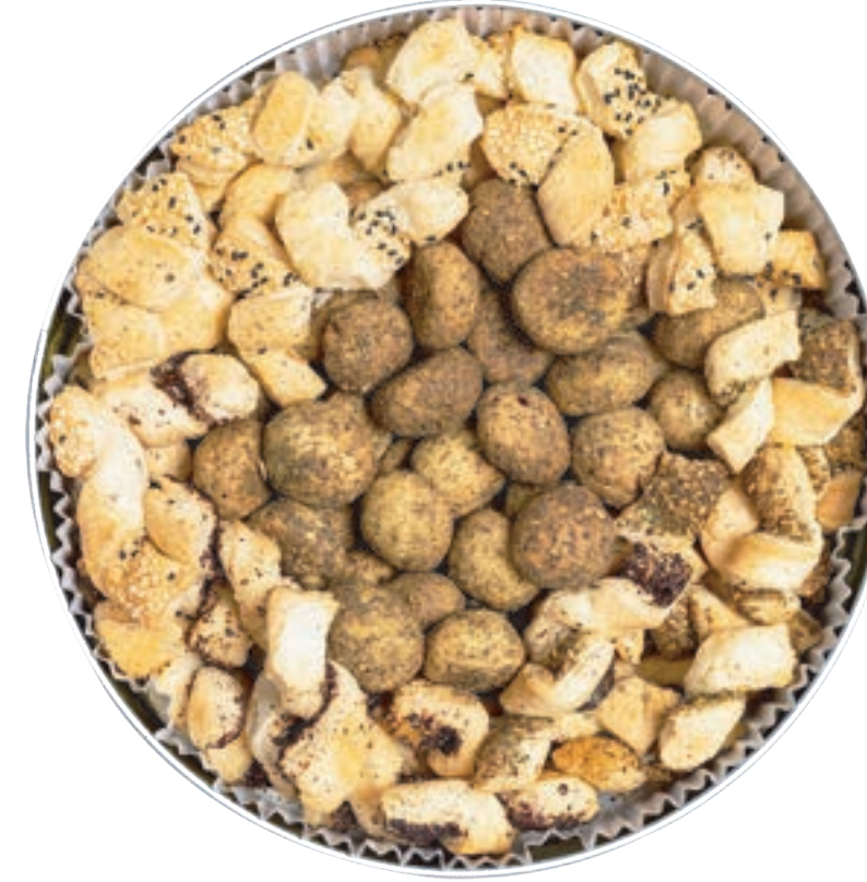
موالح Citrus Can 900g