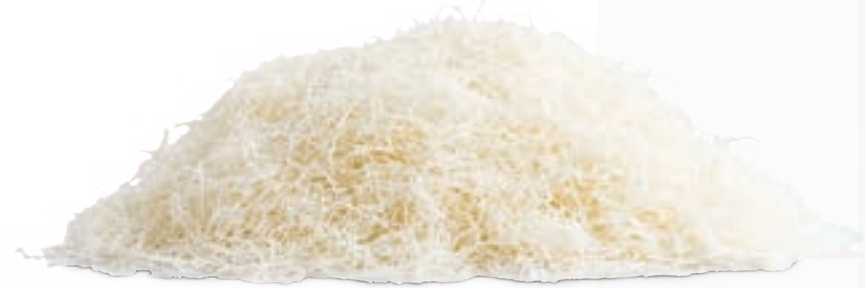
عجينة كنافة خشنة Coarse Kunafa Dough