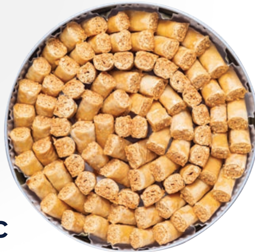
اصابع كاجو Cashew Fingers