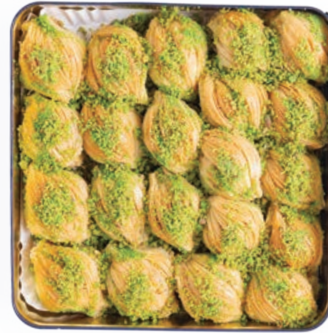
مدفیات بالجوز / فستق حلبي Walnut / Pistachio Shells