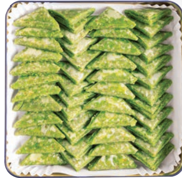
وربات تركية Turkish Warbat 700-900g