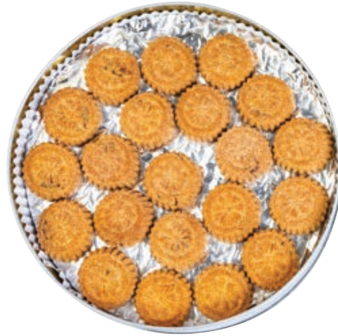
معمول نخالة بالتمر Bran Ma'amoul with Dates