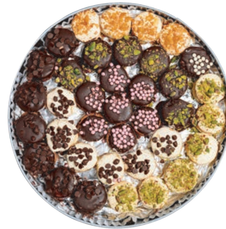
بيتي فور Petit Four 900g

Habibah 's petit four is the perfect choice for all lovers of rich flavors and high-quality.