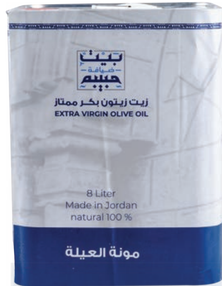
زيت زيتون Olive Oil