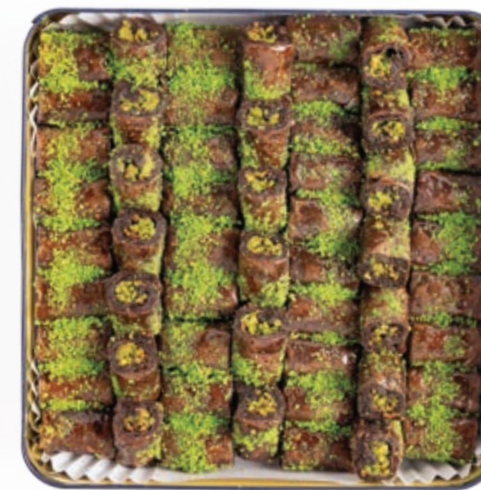
اصابع كاكاو Cacao Fingers