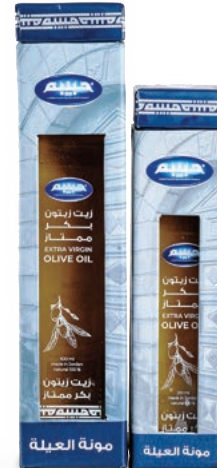
زيت زيتون Olive Oil