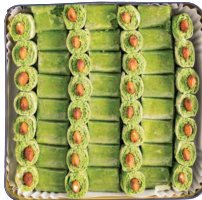
مورما لوز Almond Sourma 700-900g