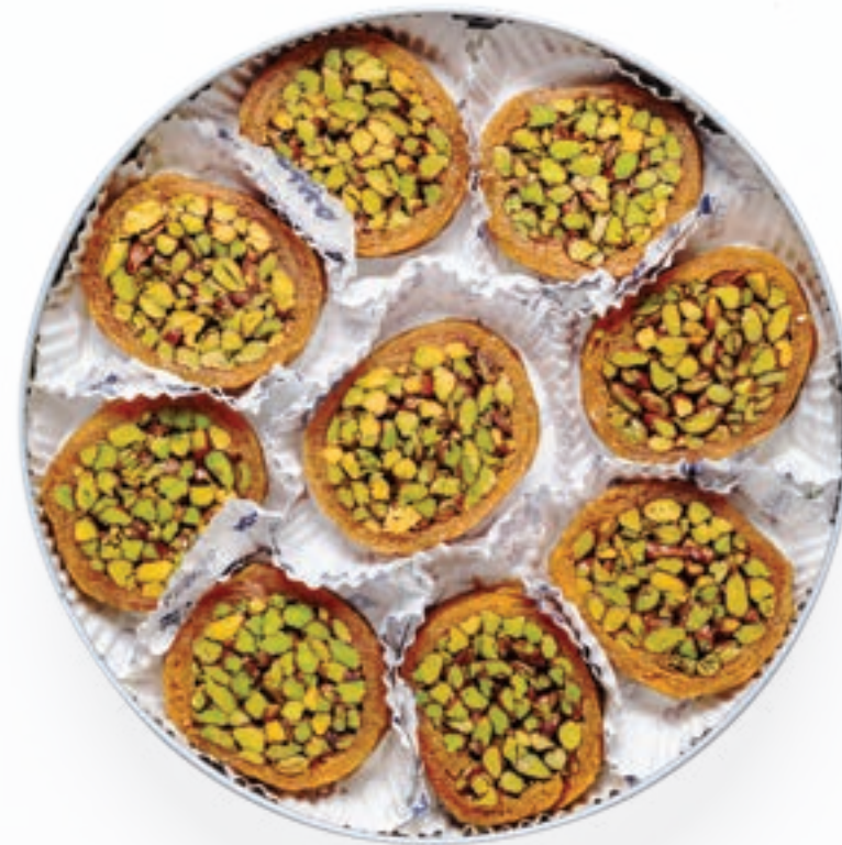
برما شامية Shamiah Burma 700 - 900 - 1300g