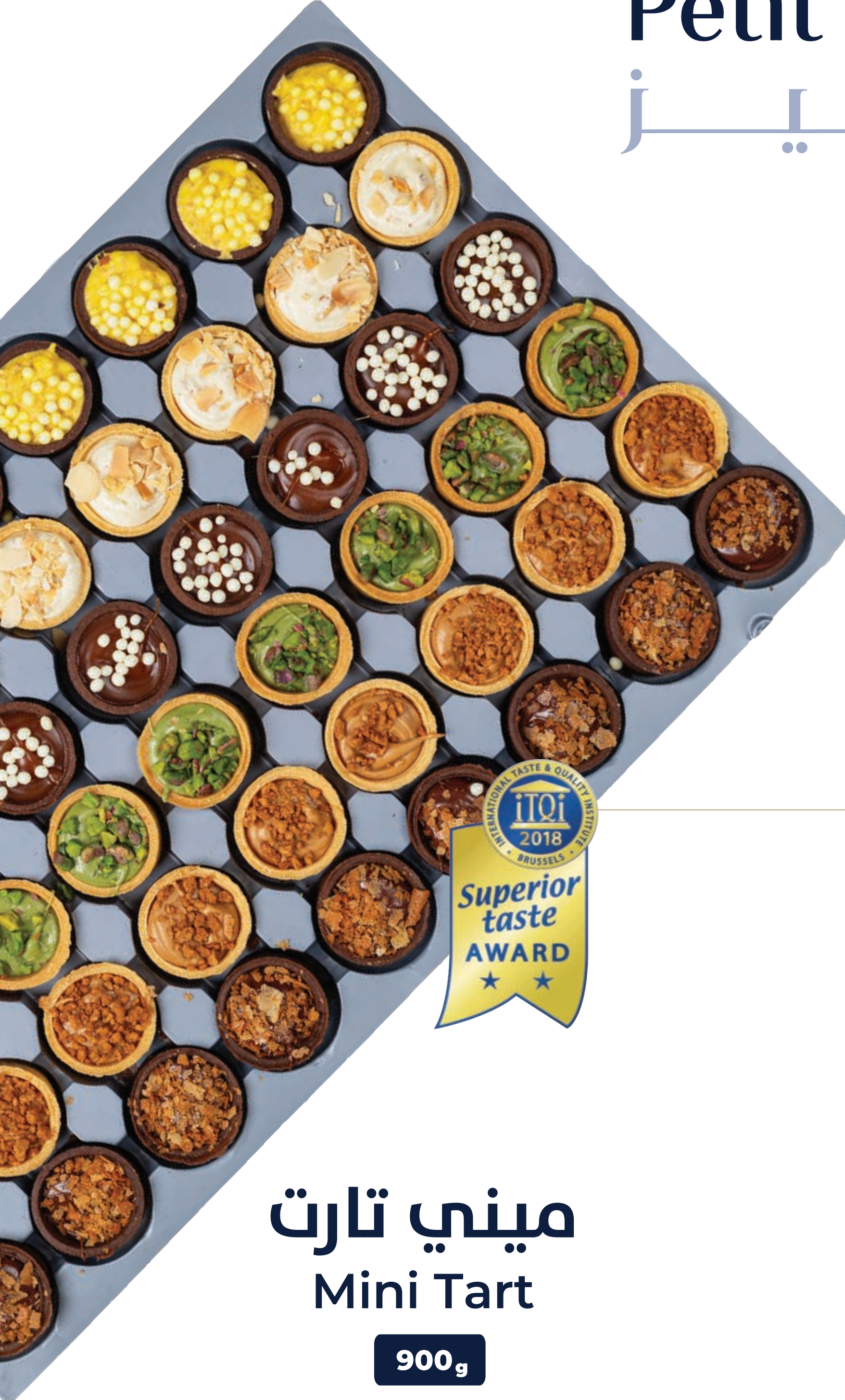
ميني تارت Mini Tart