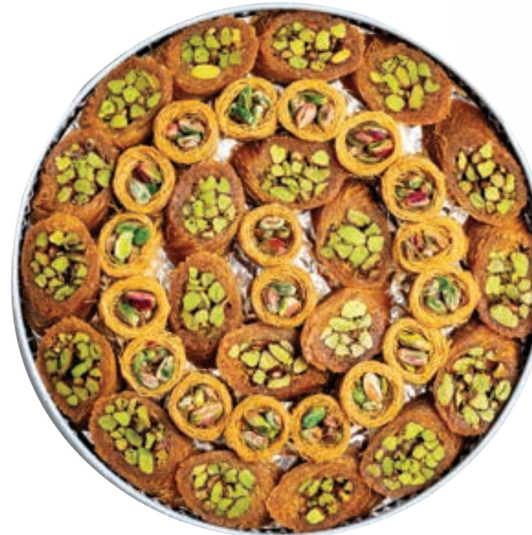
برما وعش البلبل بالفستق الحلبي Pistachio Burma & Ush Albulbul 700 - 900 - 1300g