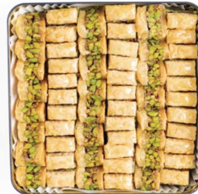
بقلاوة أصابع بالكاجو/فستق حلبي Cashew/ Pistachio Baklava Fingers