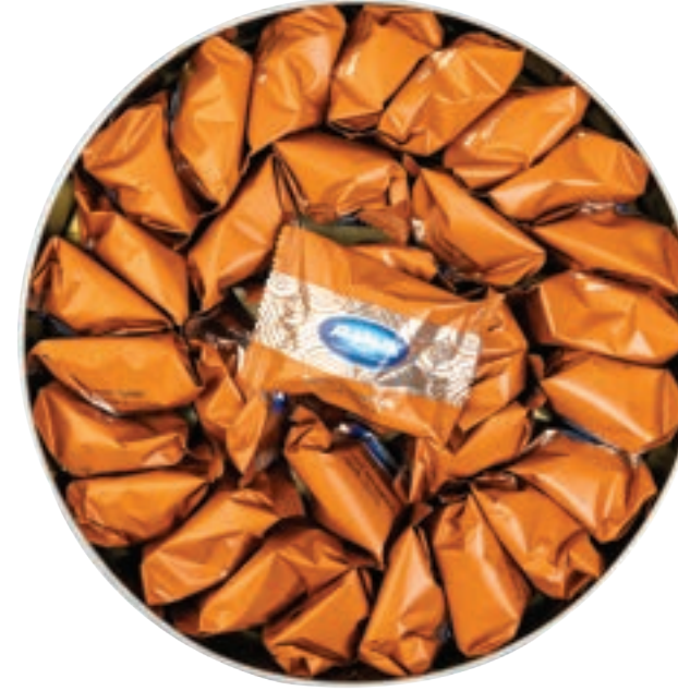
معمول جوز Walnut Ma'amoul