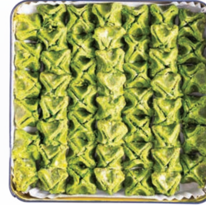
صرة تركية Turkish Surrah