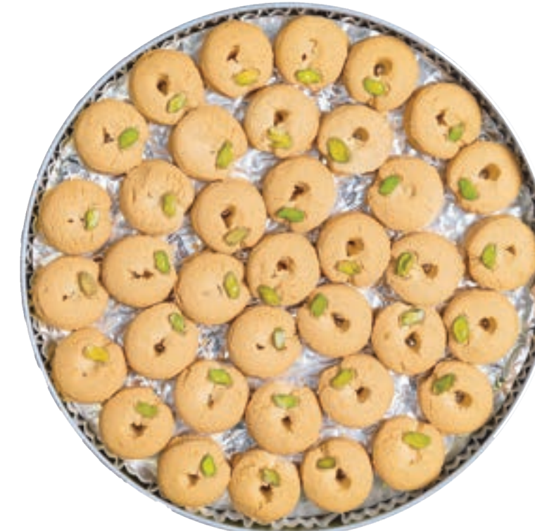
غريبة محمصة Roasted Ghraybeh 900g