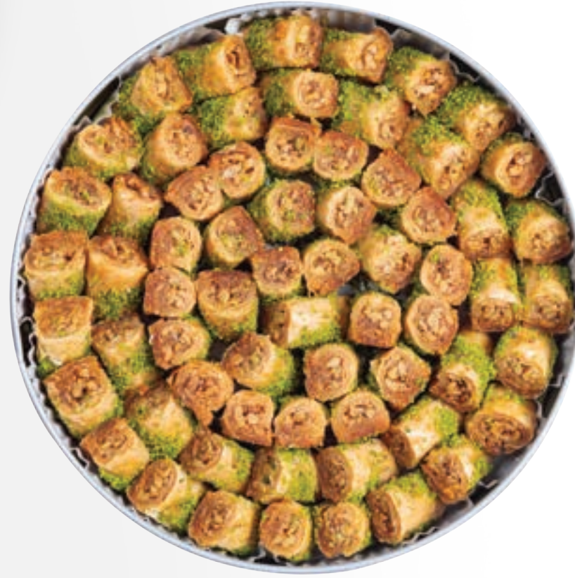
اصابع بالجوز Walnut Fingers