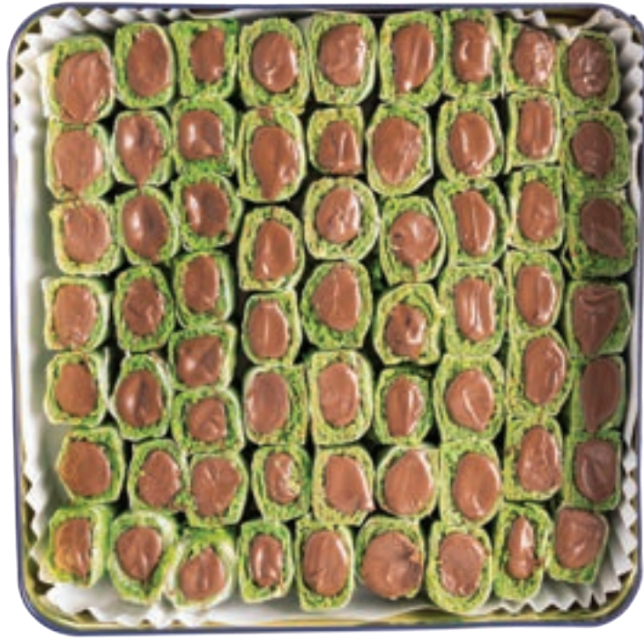
مورما نوتيللا Nutella Sourma 700-900g