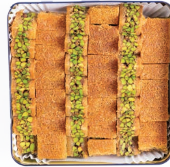
عصمليه بالفستق الحلبي / كاجو Pistachio / Cashew Osmalli