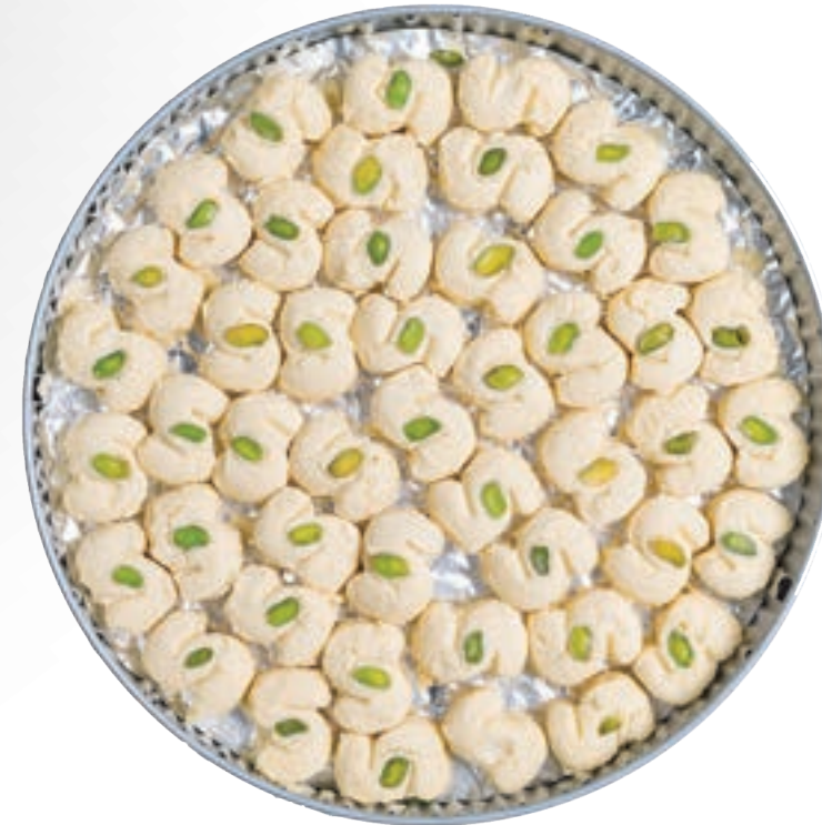
غريبة Ghraybeh 900g