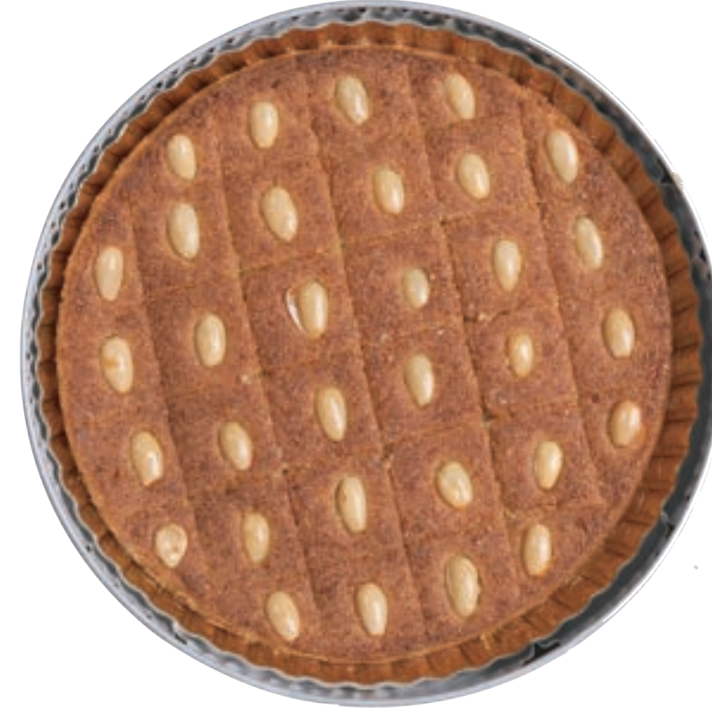
هريسة لوز Almond Harisa 900g