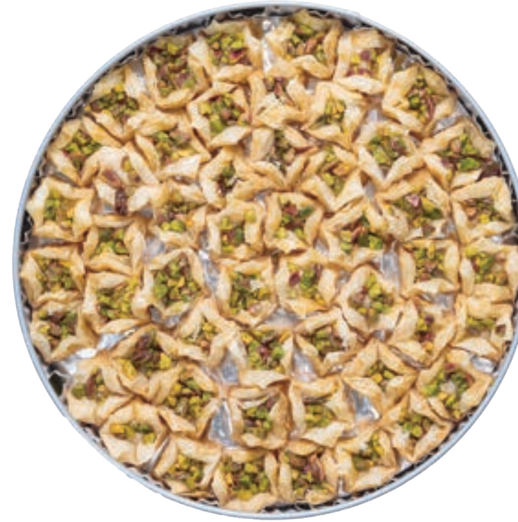
صرة بالفستق الحلبي Surrah Pistachio 700 - 900 - 1300 - 1800g