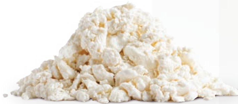
جبنة مجمدة Frozen Cheese