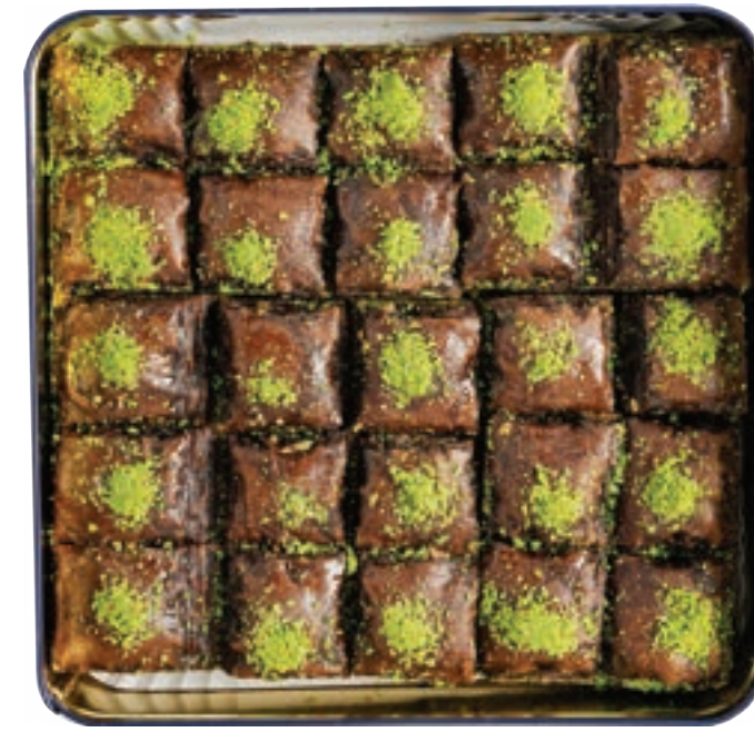
نمورة كاكاو Cacao Nammoura