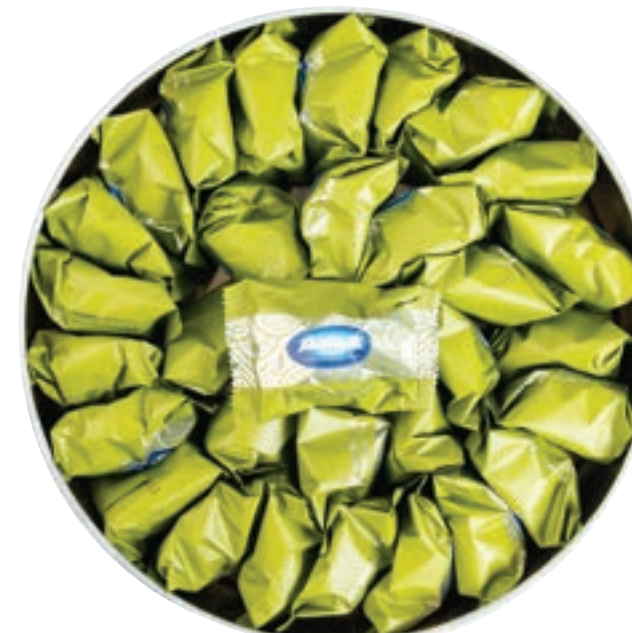
معمول فستق حلبي Pistachio Ma'amoul