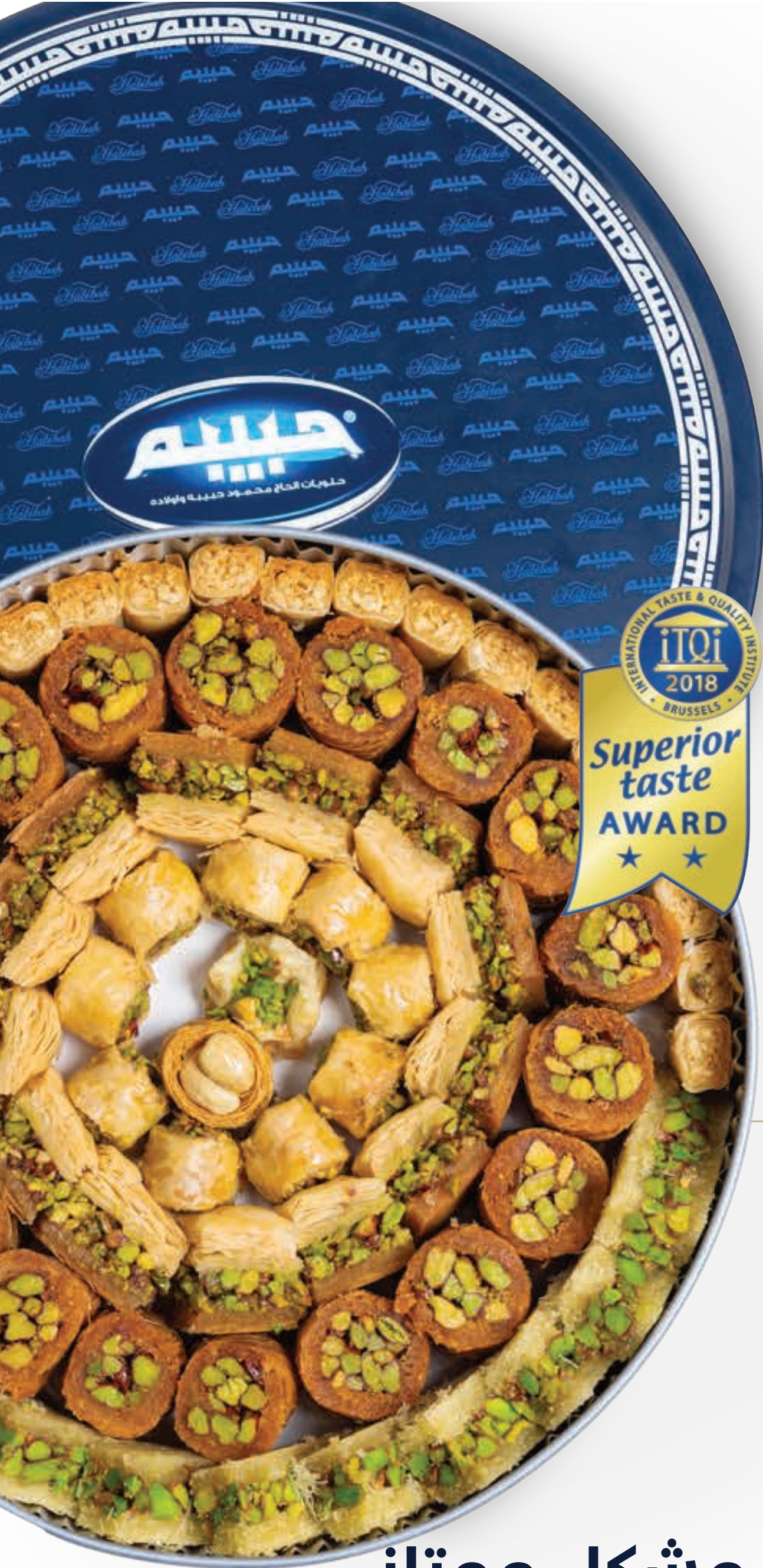
مشكل ممتاز Assorted Arabic Sweets (Mumtaz)